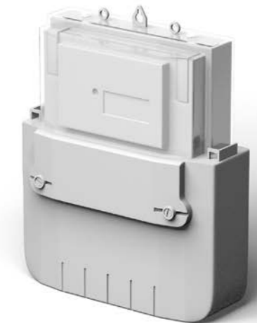
In Stromzählern müssen Vergussmassen über gute Haftung, Flammwidrigkeit und gute Fließigenschaften verfügen.

Wevo-Lösungen zum Gießen, Kleben und Dichten sorgen in Millionen von Haushalten dauerhaft für die Genauigkeit, Langlebigkeit und Qualität von Zählern.